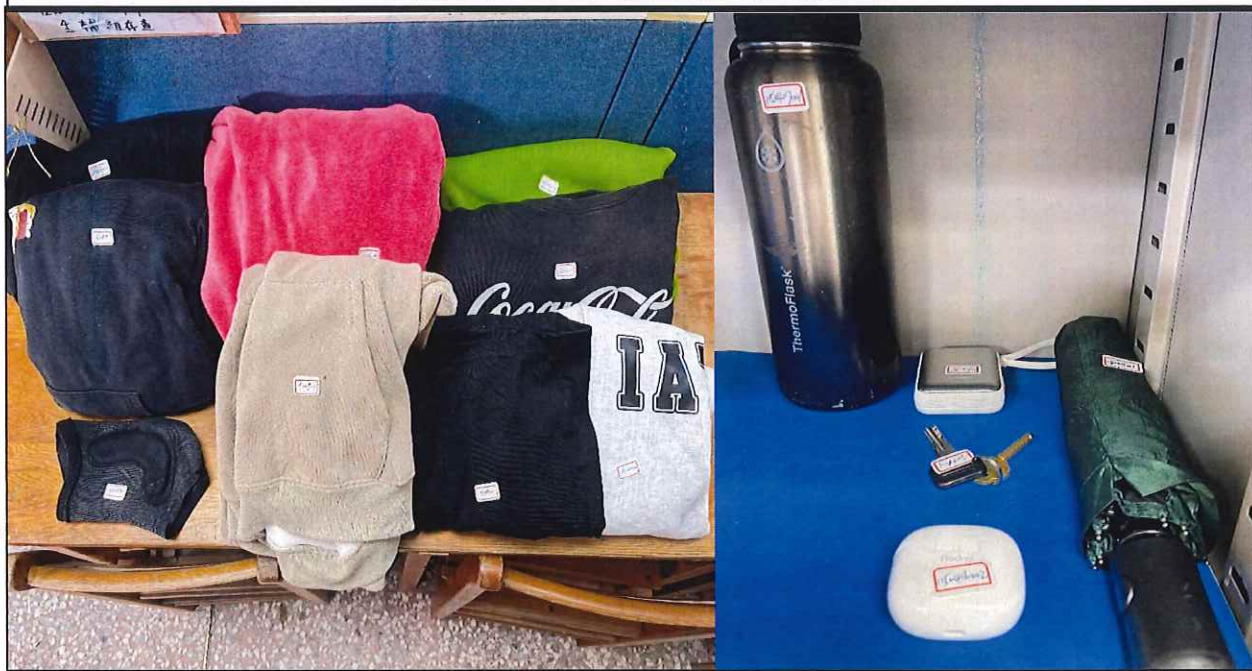
本次尚未領回的遺失物大合照如下